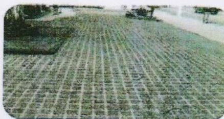
Figura 01: Corte esquemático do piso em concregrama