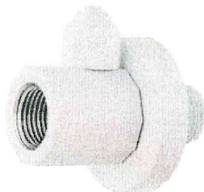
Figura 03: Conexão T entrada e saída 1/2" saída para Mangueira 1/4".