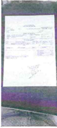
WhatsApp Image 2023-08-07 at 12.25.28.jpeg ~89 KB