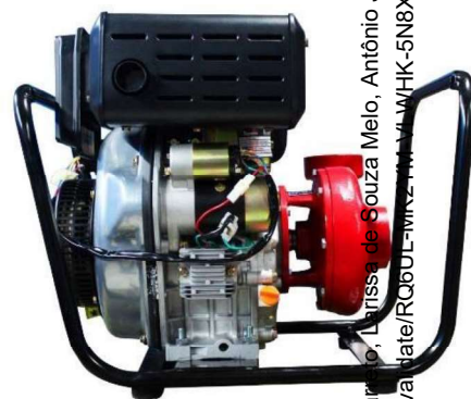
Figura 1 - imagem ilustrativa