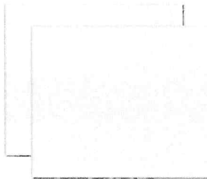
Figura 01: Revestimento cerâmico 35x57cm .