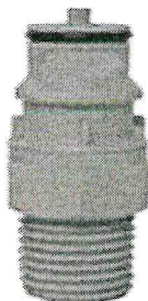
Figura ilustrativa do Item 02