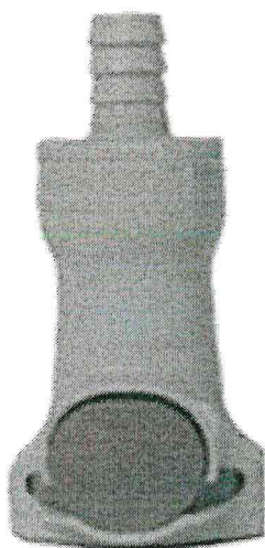
Figura ilustrativa do Item 01