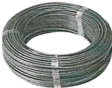
Figura 3: Condutor verde 2,5mm 2

Condutor elétrico flexível (Fio), bitola 2,5mm 2 , Cor verde, 70 °C, Tensão 750v.