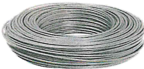
Figura 1: Condutor Vermelho 2,5mm 2

Condutor elétrico flexível (Fio), bitola 2,5mm 2 , Cor vermelho, 70 °C, Tensão 750v.