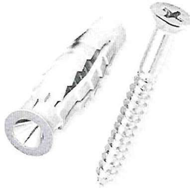
Figura 02: Imagem do parafuso com a bucha

Item 02: Parafuso 6mm cabeça chata com bucha