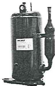
Figura 1: Compressor 22.000 Btu's.

Compressor rotativo 22.000 Btu's, 220V, para gás R-22, Split e ACJ.