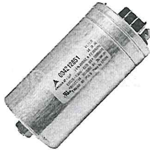
Figura 2: Capacitor 40MF 450V.