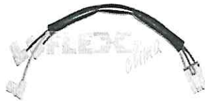
Figura 3: Chicote para compressor com conectores tipo borne.

Chicote / Cabo de ligação entre o capacitor e o compressor, com conectores borne.