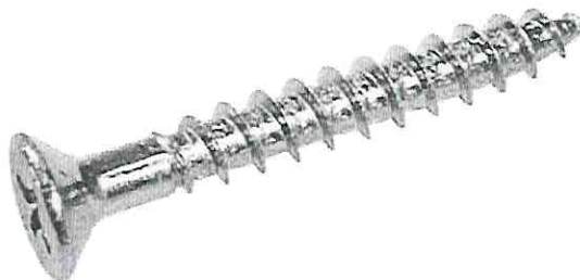
Imagem do item 5: Parafuso S6

Especificações: Parafuso Cabeça Chata Philips 4,0 x 40 mm.