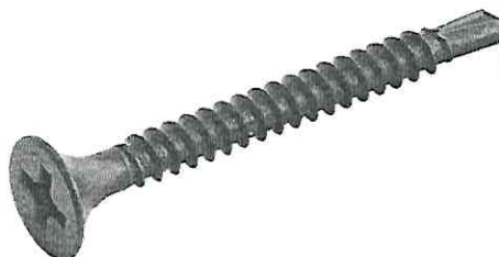
Imagem do Item 06: Parafuso drywall cabeça trombeta

Especificações: Material baixo aço carbono, Parafuso drywall Cabeça trombeta, ponta broca 3.5 x 35.