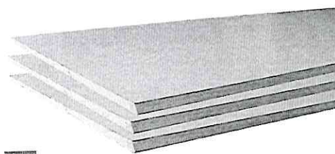
Imagem do Item 01: Divisória Naval

Especificações: Cor clara, dimensão 1,20 m x 2,11 m (largura x altura), espessura 35mm.