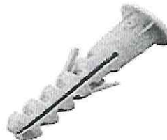
Imagem do item 4: bucha nylon com aba S6