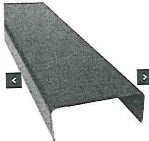
Imagem do Item 02: Guia (U)

Especificações: Perfil U, cor preto, PERFIL DIVISÓRIA NAVAL GUIA SUPERIOR Largura: 35 mm Comprimento: 3 Metros Altura: 20 mm