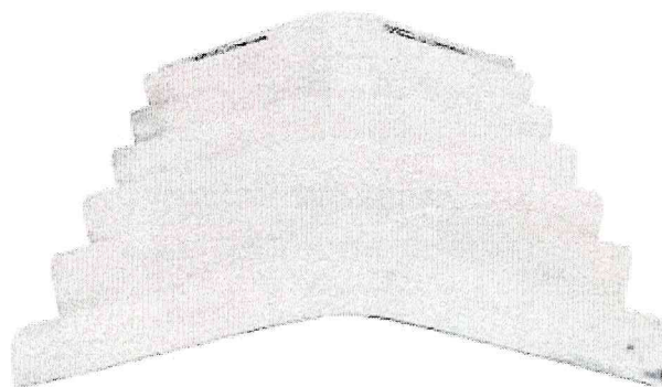
Figura 01 – Imagem ilustrativa da cumeeira

Especificação: Telha Fibrocimento Cumeeira Ondulada Cinza, dimensão de 1,10 x 0,63 m x 8 mm 15°.