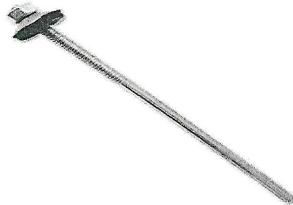
Figura 02 – imagem ilustrativa da haste

Especificação: Haste para fixação de telha 1/4" x 350 mm. utilizado para fixação em estrutura metálica.