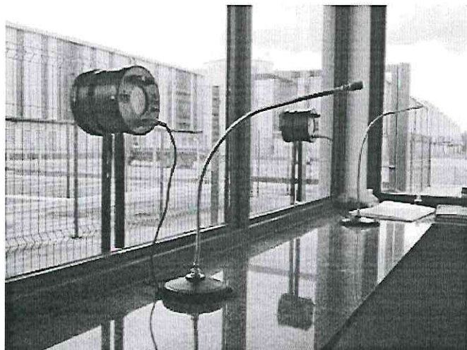
Imagem 01 - Divisória em vidro para atendimento