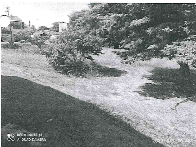
Folhas e galhos.