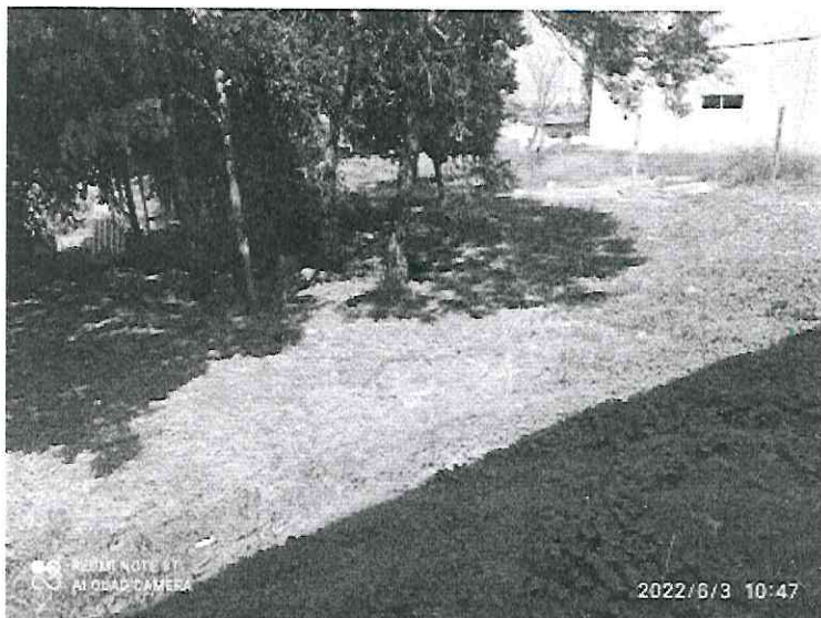
Folhagem e galhos.