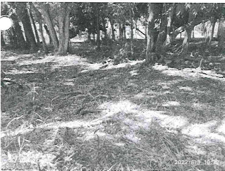
Folhas secas e gravetos.