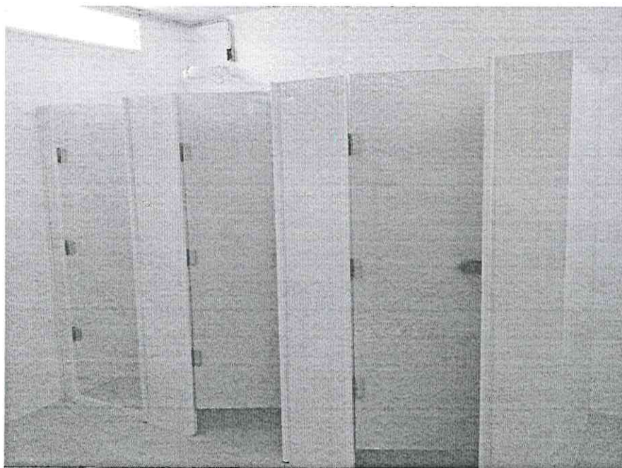
Figura item 1: Exemplo de bloqueios portas de vidro