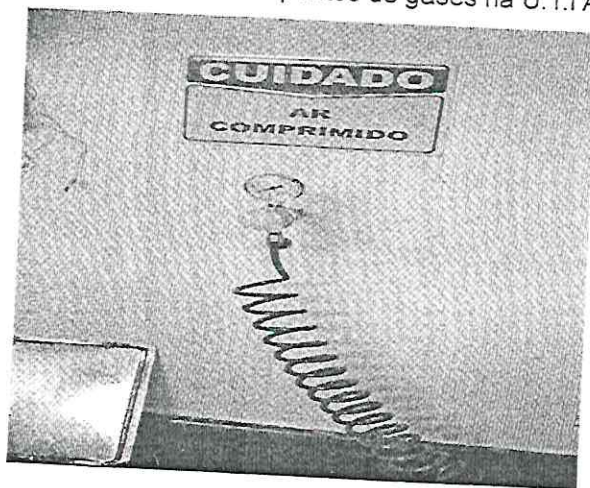
Imagem 02 – Ponto de gás na C.M.E