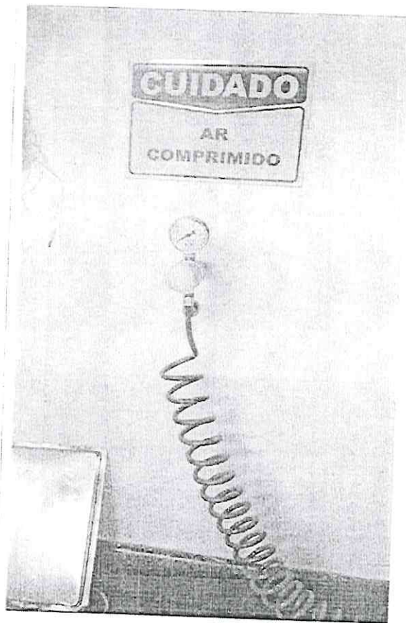
Imagem 02 – Ponto de gás na C.M.E