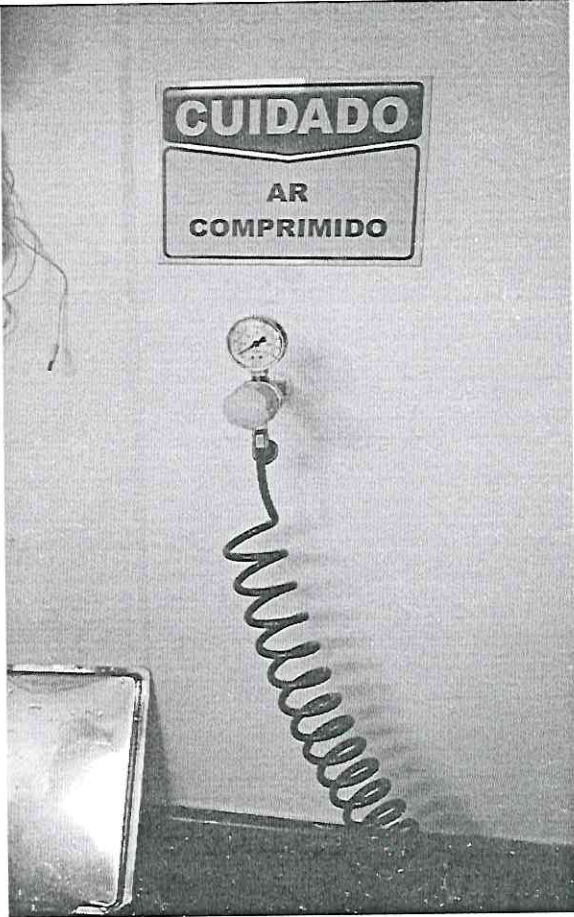
Imagem 02 – Ponto de gás na C.M.E