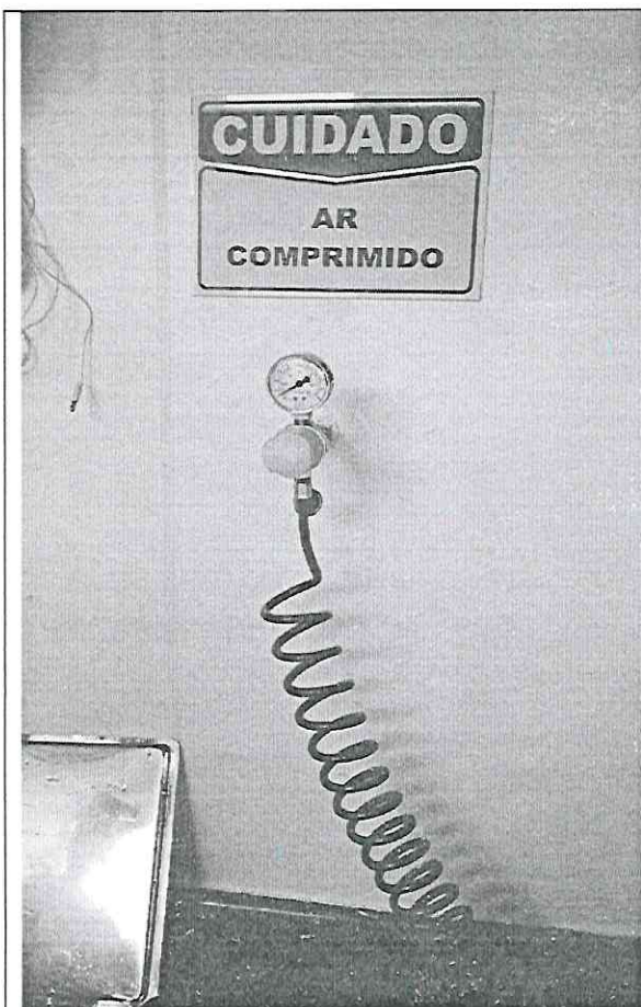
Imagem 02 – Ponto de gás na C.M.E