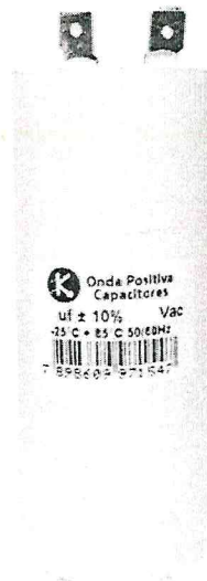
Figura 1 – Capacitor Permanente 60 UF

Especificação: Capacitância: 60 UF/MF, Tensão Nominal: 440 V, Capacitor para partida de motores trifásico