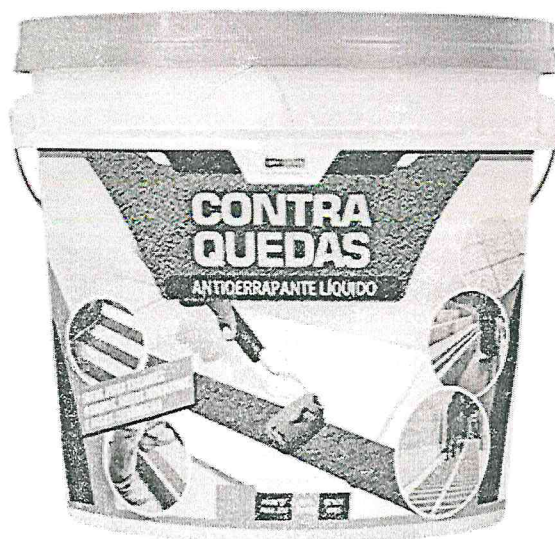
Figura item 1: Resina acrílica CONTRA QUEDAS.

Item 01: Resina acrílica antiderrapante a base de água, para aplicações em superfícies lisas, proporcionando segurança devido o aumento do coeficiente de atrito da superfície. Rendimento de 0,3 Kg/m 2 ou 300 g/m 2 .