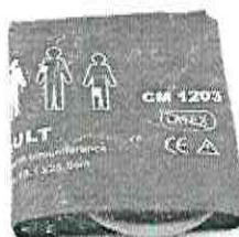
Imagem do Item 1 – imagem ilustrativa de braçadeira de nylon tamanho adulto.

Hospital de Doenças Tropicais Dr. Anuar Auad- HDT/HAA Alameda Contorno, Nº 3556, Jardim Bela Vista. Goiânia - GO CEP: 74853-120 Fone: (62)3201-3673 / (62)3201-3674