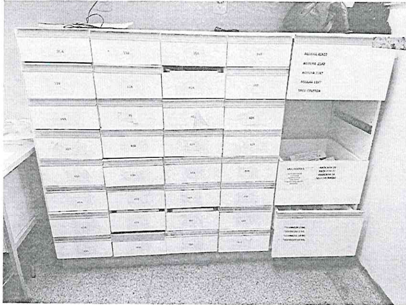
Imagem 01 - Armário existente ala C