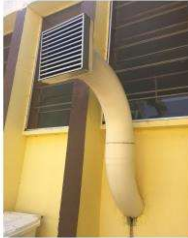
Figura 01: Insuflador de ar estéril, dotado de filtro HEPA.

2.1.18. Apresentar um laudo detalhado contendo as peças/materiais necessários para a manutenção preventiva e corretiva dos equipamentos e suas respectivas justificativas;