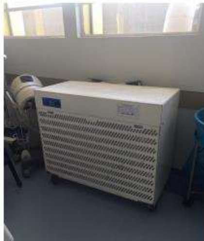
Figura 02: Duto de saída de ar filtrado para ambiente externo.

2.1.19. Todos os materiais e/ou insumos necessários a serem substituídos, deverão ser adquiridos pela CONTRATADA, mediante a três orçamentos, sob aprovação da menor cotação setor de Manutenção do HDT;